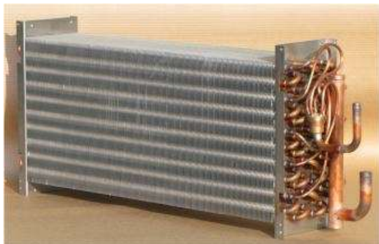
カチオン電着塗装前