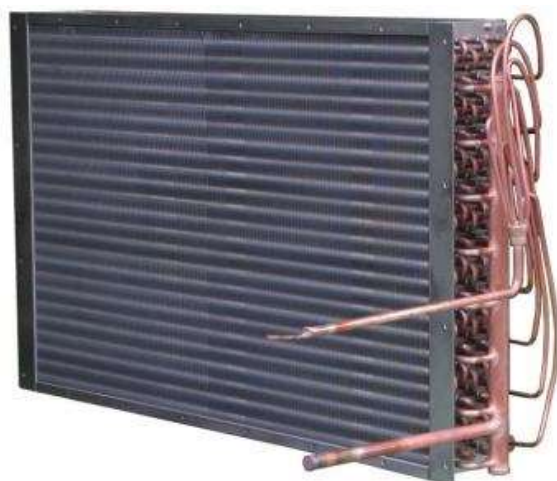
カチオン電着塗装前