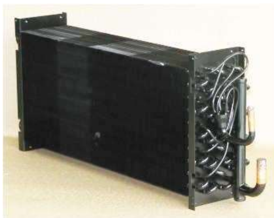
カチオン電着塗装後

銅管+アルミフィンのプレートフィンコイルに、「カチオン電着塗装」を施した例が右の写真です。